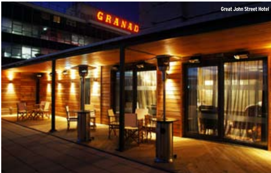
Great John Street Hotel